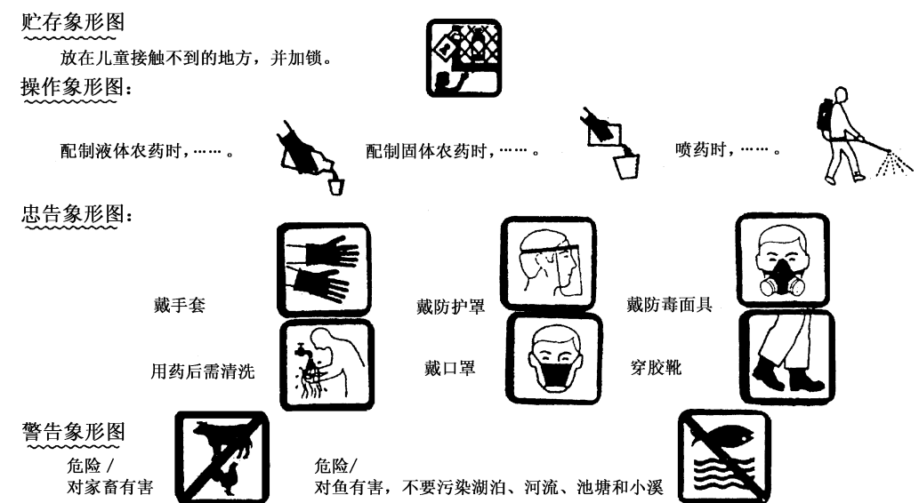
图1 象形图的种类和含义